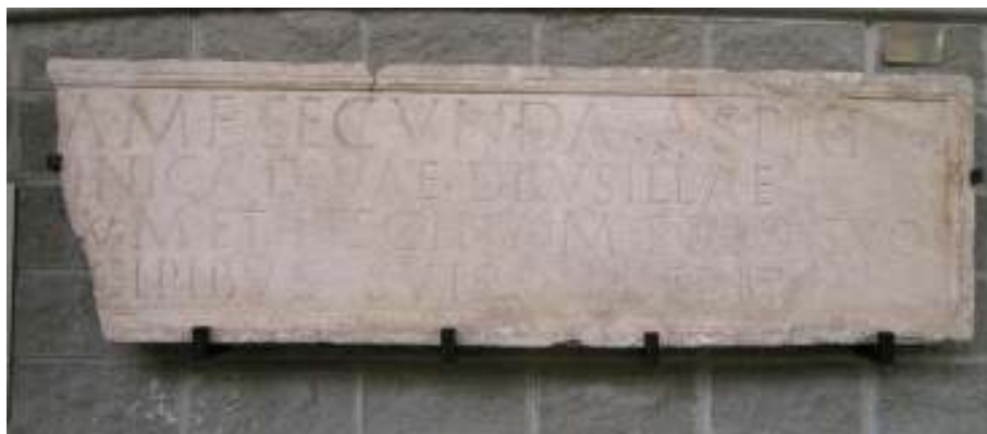
Figura 1. CIL V, 7345, esposta nel Museo di Antichità di Torino (autopsia del 23 agosto 2006)