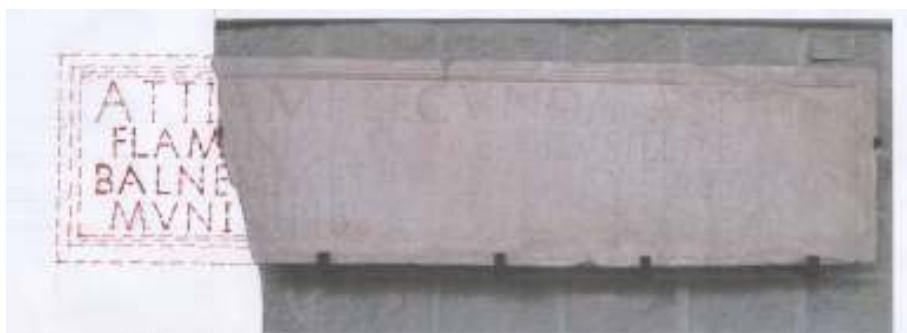
Figura 3. Ipotesi di ricostruzione grafica dell'epigrafe